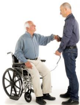
Avec le SitnStand