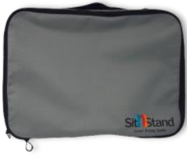
Sac de transport