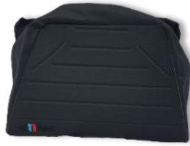
Housse de siège additionnelle