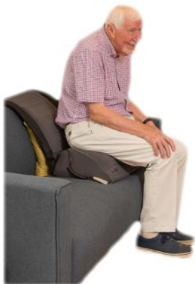
Coussin releveur pour siège Réf : 825 100