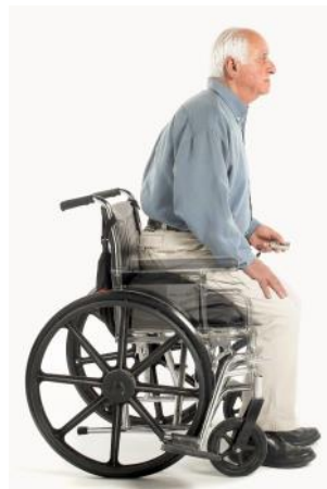
Coussin releveur pour fauteuil roulant Réf : 825 102