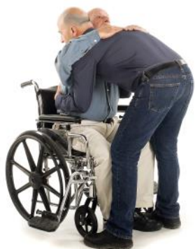
Sans le SitnStand

L'installation du coussin est facile, il suffit de poser le SitnStand plié sur le siège du fauteuil roulant et de glisser la partie arrière (celle qui contient l'unité d'alimentation) entre le dossier et le siège. Ensuite, placez les sangles de la partie arrière sur les poignées du fauteuil roulant et serrez les.